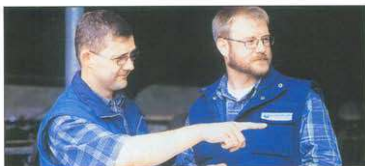
Επιστημονική υποστήριξη Schaumann

• Το ΒΙΟΡΗΘΟΣ MH για κοτόπουλα κρεοπαραγωγής είναι ιδανικός βιοισορροπιστής για παχυνόμενα γαλοπούλα, κοτόπουλα, πάπιες και χήνες.