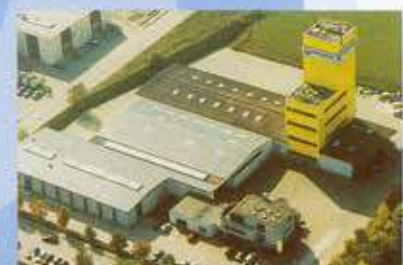
Κέντρο παραγωγής Feuchtwangen