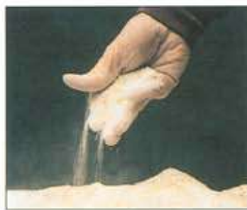
Εμπιστευτείτε σχέδια διατροφής Schaumann και ΞΕΡΕΤΕ ΤΙ ΤΑΪΖΕΤΕ!