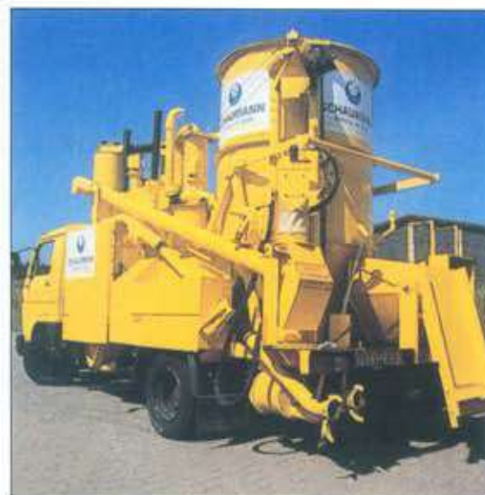
Κινητός μύλος Schaumann

Η σειρά προϊόντων Ovital κυκλοφορεί στην Ελληνική αγορά ανελλιπώς από το 1974 έχοντας πείσει πτηνοτρόφους, κτηνιάτρους, καθώς και γεωπόνους - ζωοτέχνες διαιτολόγους ότι το πρόγραμμα διατροφής Schaumann αποτελεί την πλέον αξιόπιστη και έγκυρη λύση για την σωστή επιστημονική εκτροφή των πτηνών τόσο στις συμβατικές μονάδες όσο και σ' αυτές με οικολογική κατεύθυνση. Τα τελευταία δε χρόνια διατίθεται με εξίσου πολύ καλά αποτελέσματα και η σειρά Puten-Mineral για γαλοπούλα.