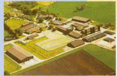
Hülseberg, πειραματικός σταθμός και μονάδα αναπαραγωγής

Τόσο η εταιρεία Schaumann , η οποία κλείνει φέτος 67 χρόνια ζωής, όσο και εμείς που συμπληρώσαμε 31 χρόνια συνεχούς συνεργασίας μαζί της συνεχίζουμε να προσφέρουμε κορυφαίας ποιότητας προϊόντα, και να είμαστε δίπλα στον Έλληνα πτηνοτρόφο, σεβόμενοι τόσο τους καταναλωτές όσο και αυτόν.