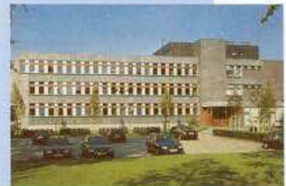
Κεντρικά γραφεία στο Pinneberg