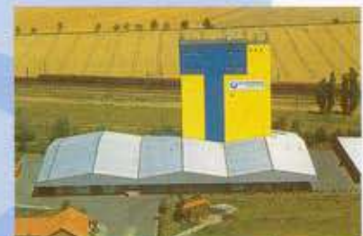
Κέντρο παραγωγής Ellseben